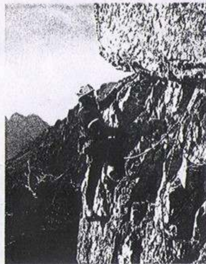
Con questo bel traverso inizia la «Diretta». (Mauro Bernardi)

Scendere in arrampicata l'ulti- mo tiro dell'itinerario nr. 63, poi traversare 7 m ad ovest fino alla doppia di 10 m. Dalla cengia continuare per l'itinerario nr. 61.