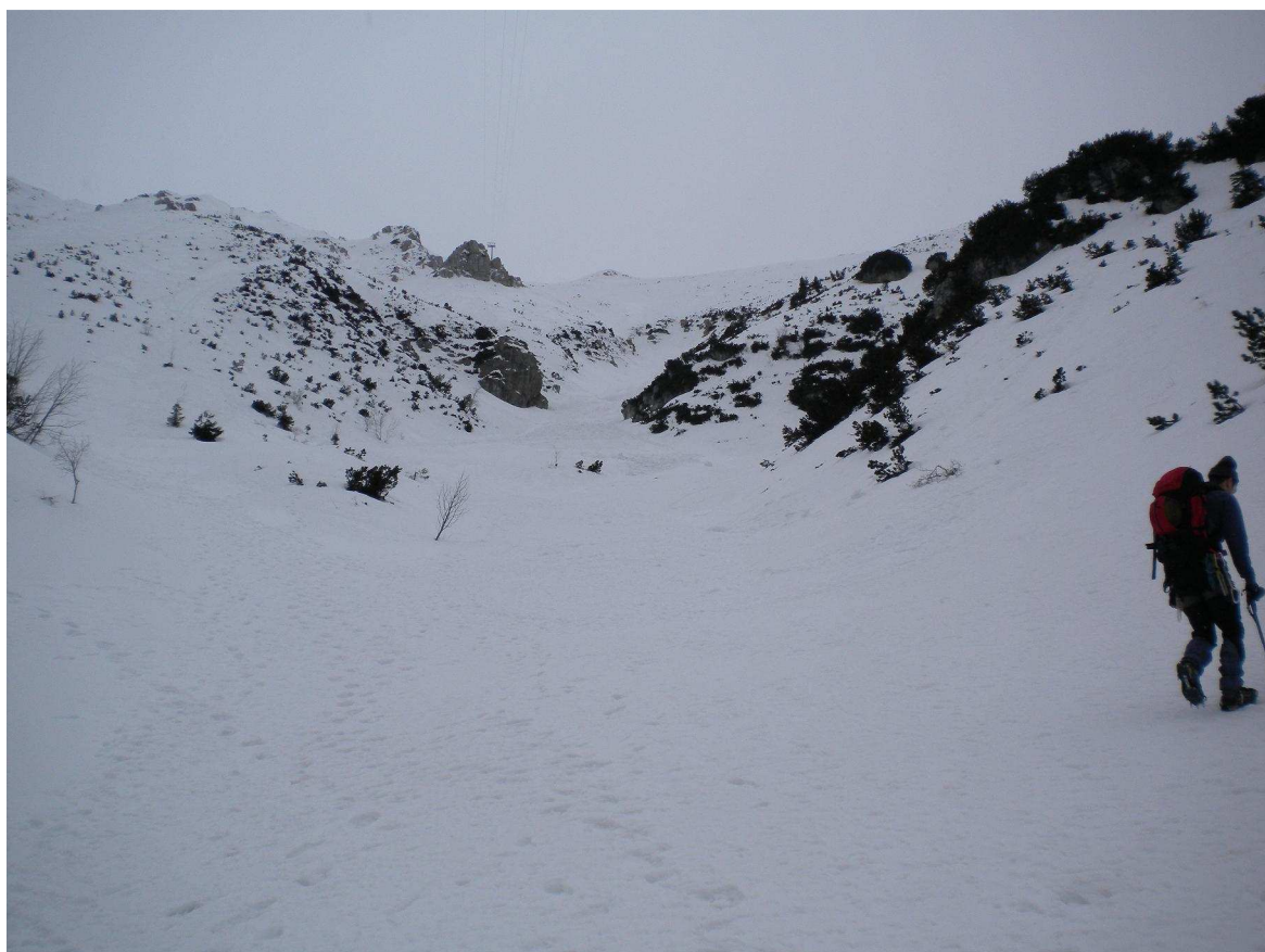
Si entra nella bacinella