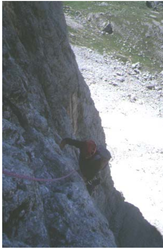
l'uscita del quinto tiro